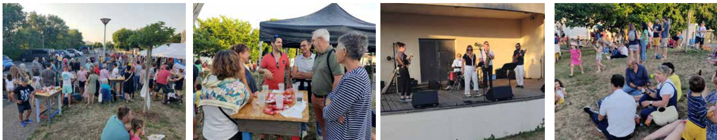
Fête de la musique et de l'école