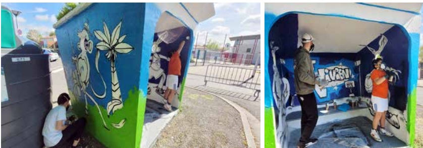
Inauguration de l'Aubette