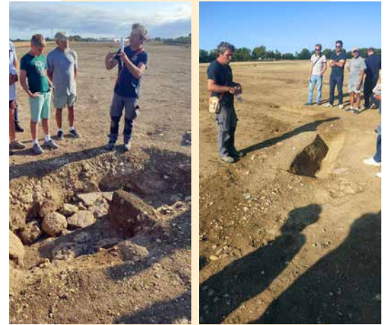
Fouilles archéologiques de la nouvelle zone d'activités