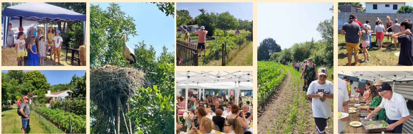
Fête du marais